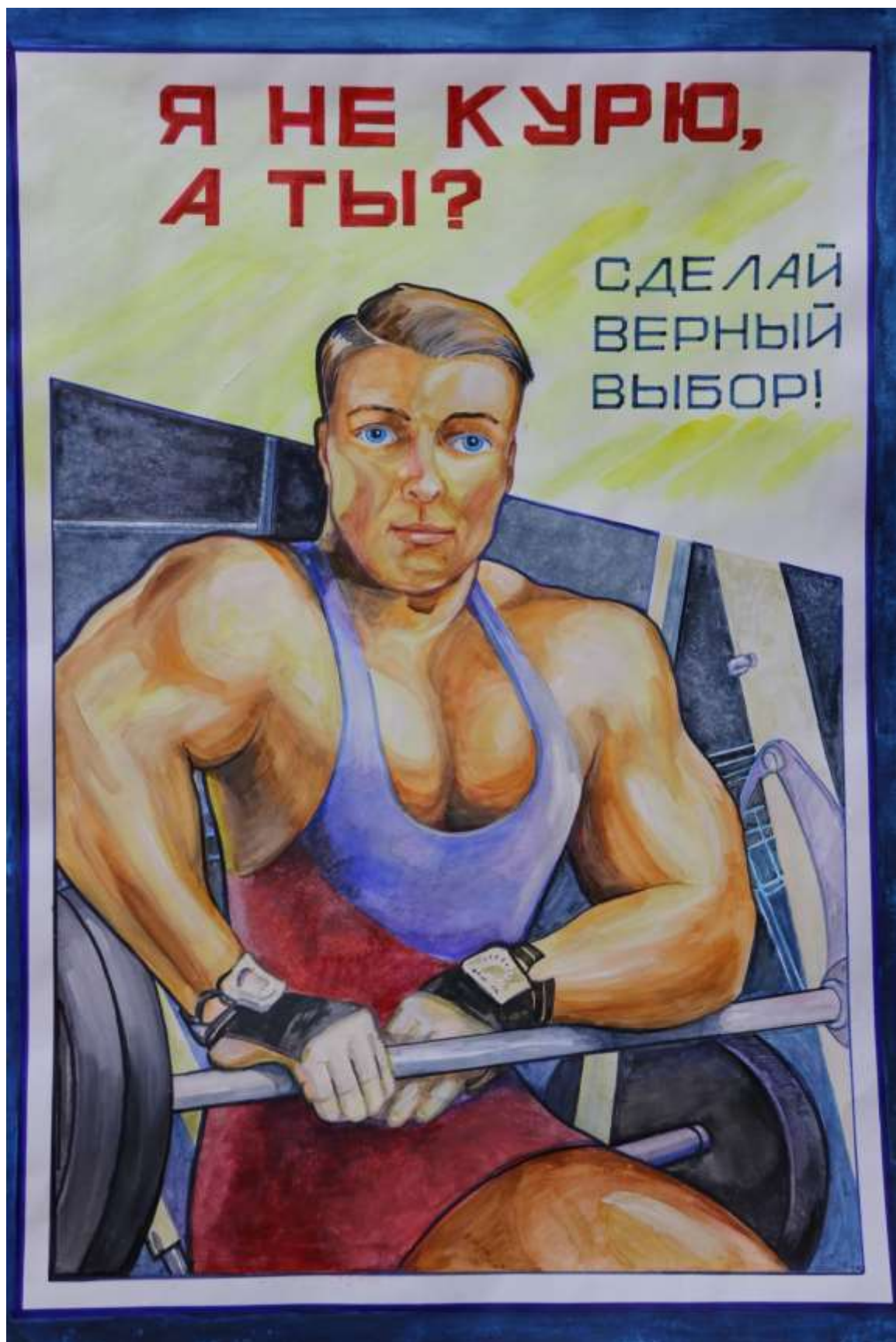
5. «Я не курю! А ты?» (85*60 бумага, гуашь) Автор- Зубарев Сергей (17 лет )